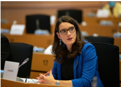
Parlamento Europeo Simona Kustec, ministra de Educación, Ciencia y Deporte de Eslovenia

Bruselas (19/11/21).- El Consejo ha adoptado un reglamento del Consejo por el que se establecen empresas comunes en el marco del programa Horizonte Europa. Las empresas conjuntas complementan el marco actual de Horizonte Europa al abordar los desafíos y las prioridades globales que requieren una masa crítica y una visión a largo plazo.