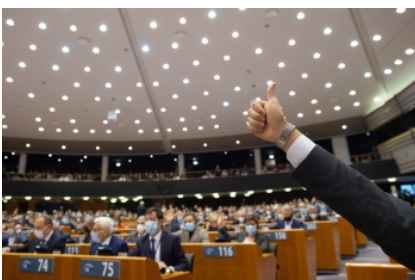
Parlamento Europeo Parlamento

Bruselas (19/11/21).- El aumento de casos en toda Europa ha precipitado que la sesión plenaria de la semana que viene, vuelva a un sistema híbrido que permita que los eurodiputados puedan participar de forma telemática. El plenario contará con la aprobación final de la reforma de la PAC, un debate sobre la situación en la frontera entre Polonia y Bielorrusia y la participación de la líder opositora bielorrusa Svetlana Tijanovskaya.