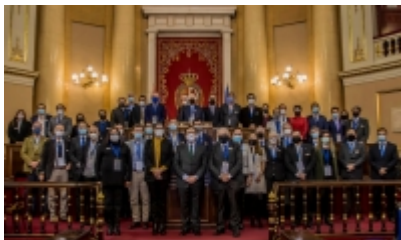
V Congreso de Editores de medios Europa América - Latina