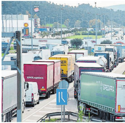
Congestión de camiones en la AP-7

El trabajo se ha planteado como una radiografía de la situación ac-